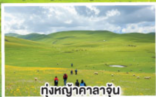
ทุ่งหญ้าคาลาจัน