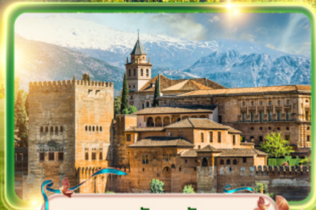
พระราชวังอาลัมบรา