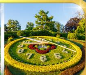
นาฬิกาดอกไม้เมืองเจนีวา

เดินทาง 9 วัน 6 คืน 09-17 ก.พ.69 22-30 มี.ย.69