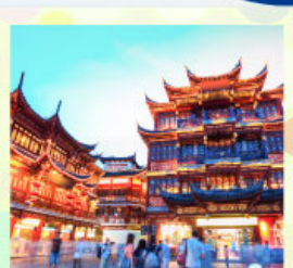
ตลาดร้อยปีเฉิงหวังเหมียว