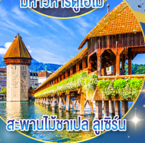
สะพานไม้ชาเปล ลูเซิร์น