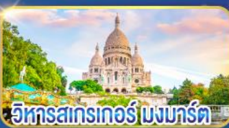
วิหารสตรกเกอร์ มงมาร์ต