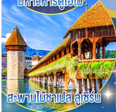
สะพานไม้ชาเปล ลูซิร์น