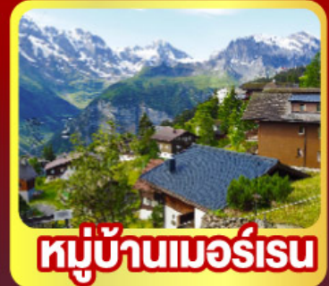
หมู่บ้านเมอร์ส

พิเศษ!! พิซิต 4 เท ยอดเทารีกี , ยอดเขาจุงเฟรา ยอดเขารอนเนอร์เกรตและยอดเขาเอกทิสวอร์น