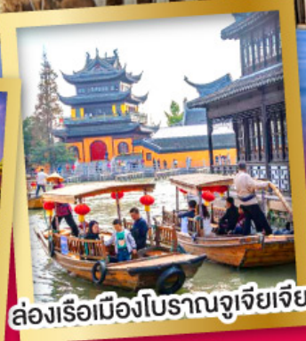
ล่องเรือเมืองโบราณซูโจวเจียว