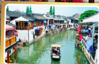
เมืองโบราณจู่เจียเจี้ยว