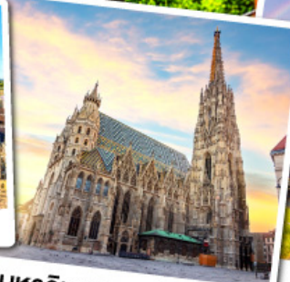
มหาวิหารเซนต์สตีเฟน