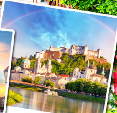
ซาลส์บวร์ก