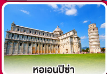
หอเอนปิซ่า