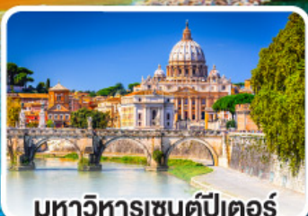
มหาวิหารเซนต์ปีเตอร์