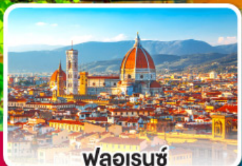
ฟลอเรนซ์