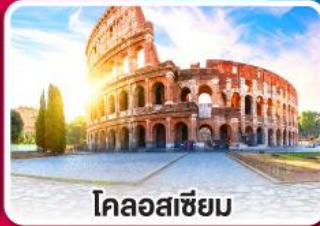
โคลอสเซียม

ลิ้มรสพาสต้า พิซซ่า และสปาเก็ตตี้ แบบต้นตำหรับอิตาลีเลียน