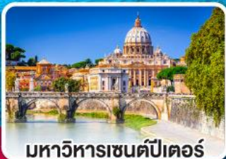
มหาวิหารเซนต์ปีเตอร์