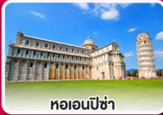
หอเอนปิซ่า