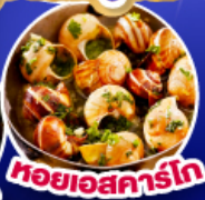
หอยเอสคาร์โก

เดินทาง 11-19 ต.ค.67/ 14-22 พ.ย.67 25 ธ.ค.67 - 2 ม.ค.68(เทศกาลปีใหม่)