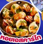
หอยเอสคาร์โก