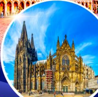
มหาวิหารแห่งโคโลญ