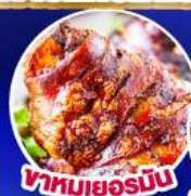
ขาหมูเยอรมัน