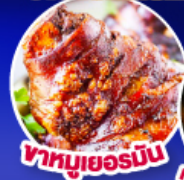
พาหมูเยอรมัน