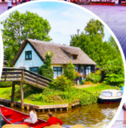
หมู่บ้านกีธูร์น