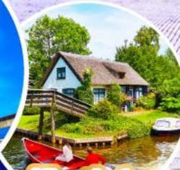
หมู่บ้านกีร์ซัน