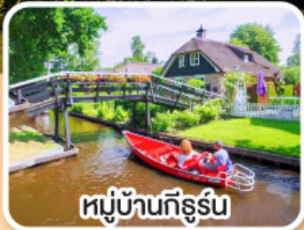
หมู่บ้านทึร์น