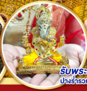
รับพระพิฆเนศวร ปางรำรอย ท่านละ 1 องค์