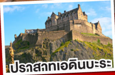
ปราสาทเอดินบะระ