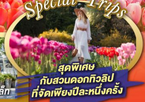
สุดพิเศษ กับสวนดอกทิวลิป ที่จัดเพียงปีละหนึ่งครั้ง