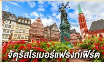
จัตุรัสโรเมอร์เฟรงก์เฟิร์ต