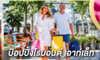
ป๊อปป์ปิงโรมอนด์ ไอท์ทอลล์