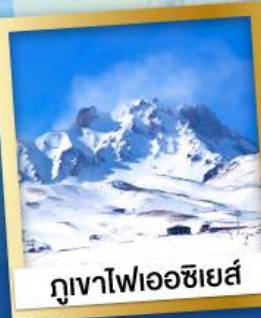
ภูเขาไฟเอซียส์