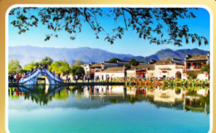
หมู่บ้านผดโลก หงซุน