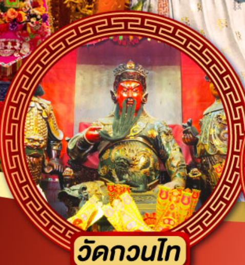
วัดกวนไท