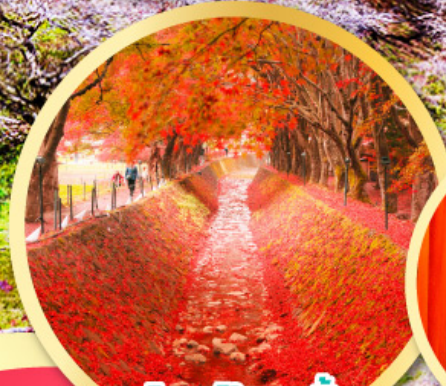
อุโมงค์ใบเมเปิ้ล โมมิจิ โคโร