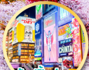
ช้อปปิ้งย่าน ชินโซบาสึ