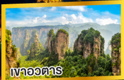
เวาอวตาร

2 เมืองโบราณ ฟูหรงเจิ้น เฟิ่งหวง 6วัน 5คืน