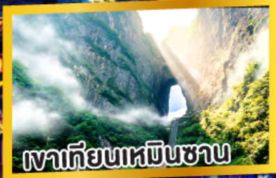
เวาเทียนเหมินชาน