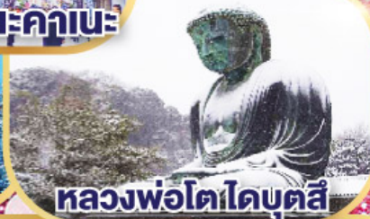
หลวงพอโตโดบตล