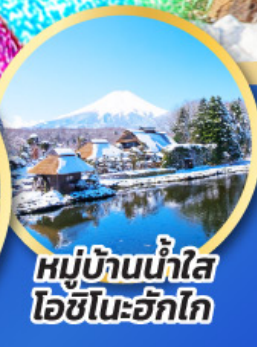
หมู่บ้านน้ำใส ไอชิโนะอัทสึ