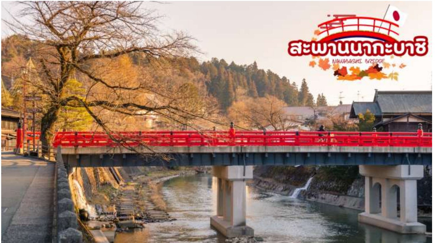
สะพานนาคะบาชิ (Nakabashi Bridge) สะพานสีแดงของย่านเมืองเก่า สะพานทอดข้ามแม่น้ำมิกากาว่าที่ไหลผ่านใจกลางเมือง สะพานแห่งนี้ถือเป็นสัญลักษณ์ของเมืองทาคายาม่า

เมืองเก่าทาคายาม่า (Takayama Old town) หรือ ถนนชั้นมาจิซุจิ ซึ่งเป็นหมู่บ้านเก่าแก่สมัยเอโดะกว่า 300 ปีก่อน ที่ยังอนุรักษ์และคงสภาพเดิมได้เป็นอย่างดี อีสระให้ทุกท่านได้เดินเที่ยวและชื่นชมกับทัศนียภาพเมืองเก่าซึ่งเต็มไปด้วยบ้านเรือนโบราณ และร้านค้าหลากหลาย เช่น ร้านอาหาร ร้านขายของที่ระลึก ร้านงานศิลปะ