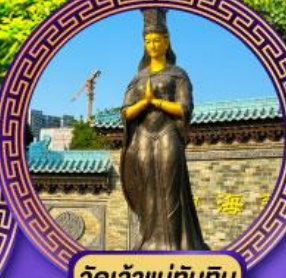
วัดเจ้าแม่กิมทิม