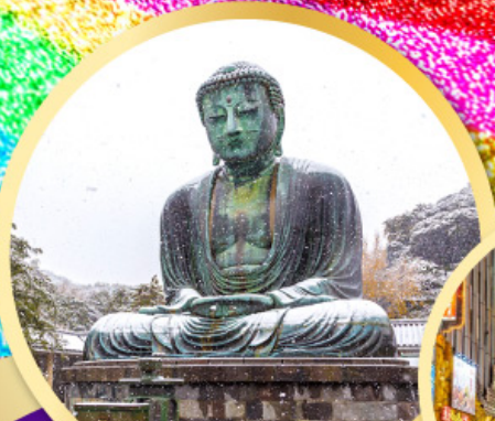
หลวงพ่อโตโคบูตสึ