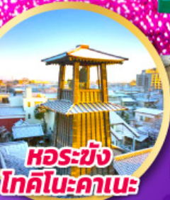
หอรบั้ง โทคิโนะคานะ