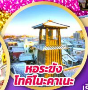
หอรบั้ง โทคิโนะคานะ