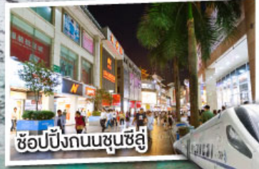
ช้อปปิ้งถนนชุนชี่