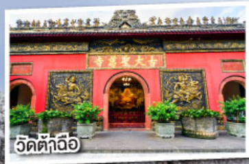
วัดต้าถื่อ