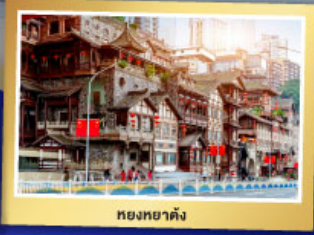
หอยหยาดิ่ง