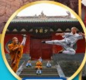
วัดเส้าหลิน ตำนานกั๋งฟู