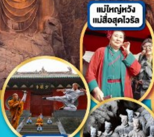
แม่ใหญ่หวัง แม่สื่อสุดไวรัล