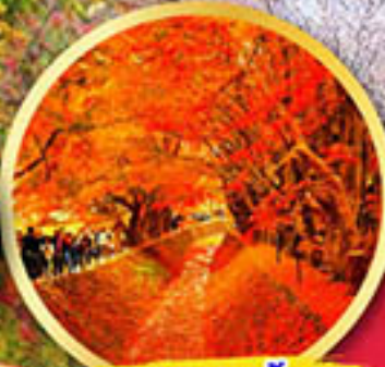
อุโมงค์ใบเมเปิ้ล โมมิจิ ไคโร