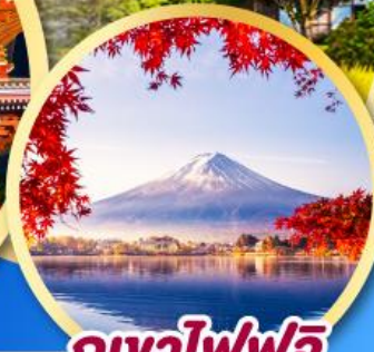
ภูเขาไฟฟูจิ