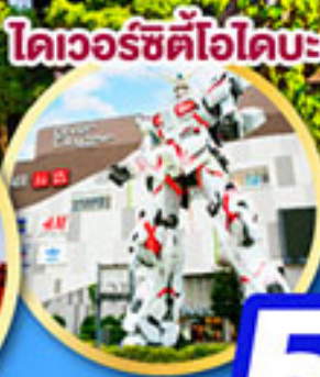
โดเวอร์ซิตีไอบะ