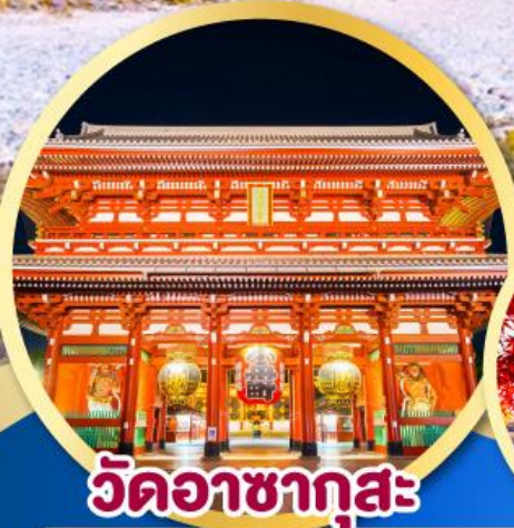
วัดอาซากุสะ