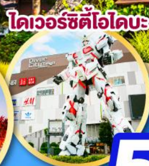
โดเวอร์ซิตีอโดมะ