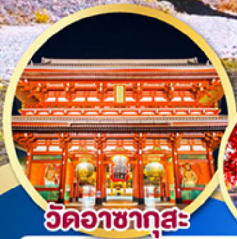
วัดอาซากุสะ