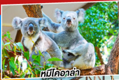
หมีโคอาล่า