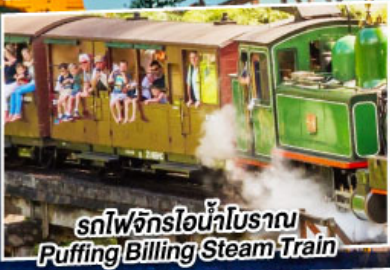
รถไฟจักรไอน้ำโบราณ Puffing Billing Steam Train