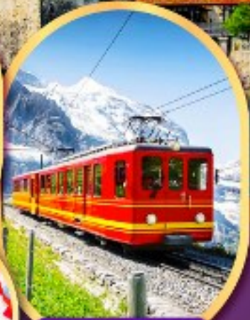
รถไฟคู่ ยอดเขาจุงเฟรา