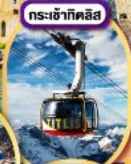
กระเช้ากิตลิส