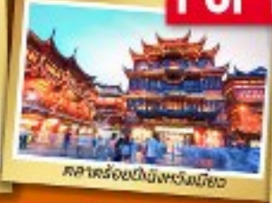
ศาลาจำลองกำแพงเมืองจีน