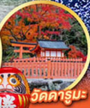
วัดคารุมะ