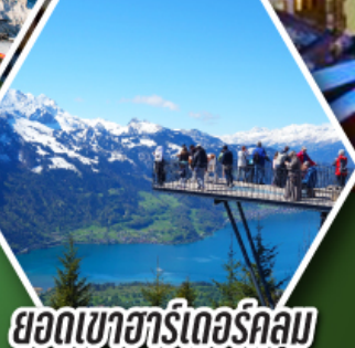
ยอดเขาอาร์ดอร์คคุม

พักเมืองเซอร์แมท เมืองตากอากาศระดับโลก ที่มีฉากหลังเป็นยอดเขามัตเตอร์ฮอร์น ราคาเริ่มต้น