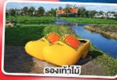
รองเท้าไม้