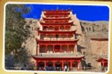
กำแพงสลักม่อเกา