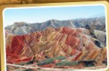
ภูเขาสายรุ้งจางเย่