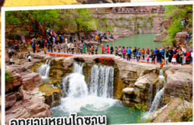
อุทยานหยุนโกซาน