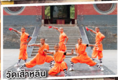
วัดเส้าหลิน