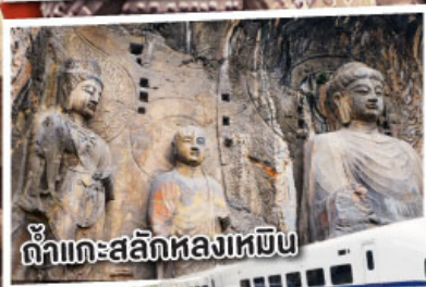
ถ้ำแกะสลักหลงเหมิน