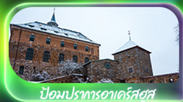
ป้อมปราการอาร์คติก