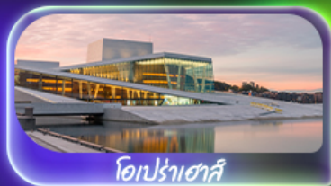
โอเปร่าเฮาส์

13-21 พ.ย. 69 / 04-12 ธ.ค. 69 25 ธ.ค. 69 - 02 ม.ค. 70 (ปีใหม่)