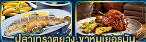
ปลาเทราต์ย่าง, จานหมูเยอรมัน

Season Germany Austria Czech of romance.. Slovenia Hungary