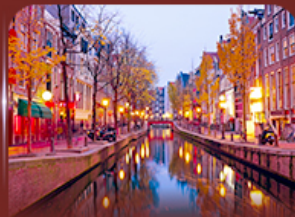
ย่าน Red Light อัมสเตอร์ดัม