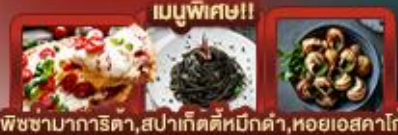
เมนูพิเศษ!! พิซซ่ามาการิตา, สเปากัดตีหมึกดำ, หอยเอสคาโต