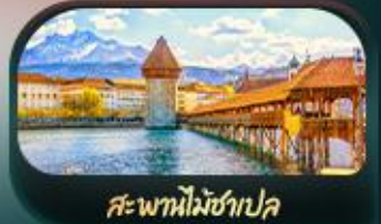
สะพานไม้อ่าเปล