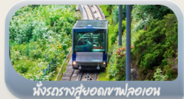
นั่งรถรางสู่ยอดเขาฟลออน