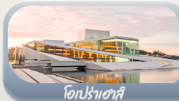
ไอเปร่าฮาส์

11-19 มิ.ย. 69 / 23-31 ก.ค. 69 / 05-13 ส.ค. 69 03-11 ก.ย. 69 / 24 ก.ย.-02 ต.ค.69