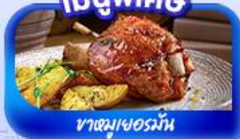
ขาหมูเยอรมัน