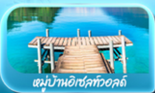
หมู่บ้านอิเชิลทออลด์