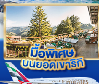
มือพิเศษ บนยอดเขารัก