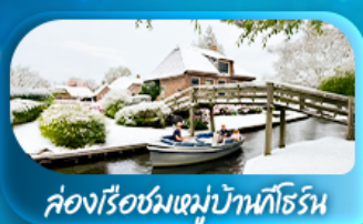
ค่องเรือชมหมู่บ้านทือโรน

พิเศษ ล่องเรือแม่น้ำเซน ชมเมือง โดย บาโต มูช