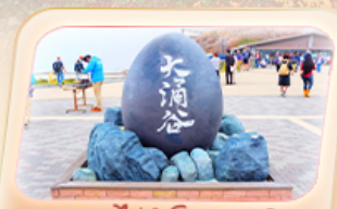
อนุสาวรีย์เจ้าโอวาคุดานิ