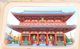
วัดฮาซากุสะ