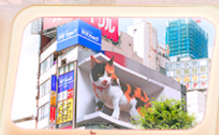
ช้อปปิ้งย่านชินจูกุ