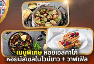
เมนูพิเศษ หอยแครงคาโก้ หอยมัสเซลไวน์ขาว + วาฟเฟิล

แถมฟรี! น้ำดื่ม 1 ขวดทุกวัน, ปลั๊กไฟยูนิเวอร์แซล