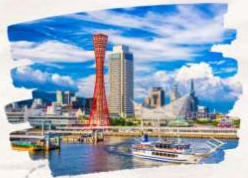
โทเฆฮาร์เบอร์แลนด์

ทริปเที่ยวเที่ยวครบ ธรรมชาติ ศาลเจ้า ปราสาท และออนเซ็น