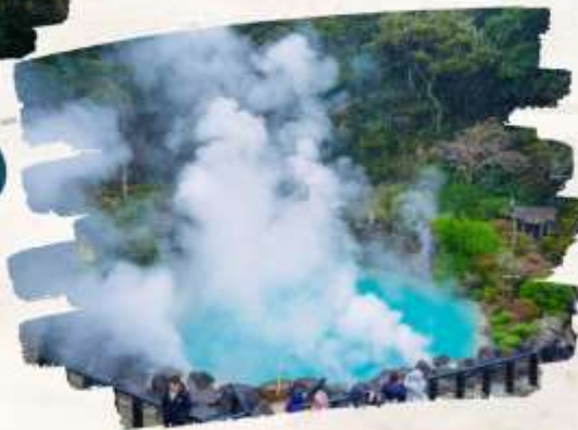
บ่อน้ำพุร้อน