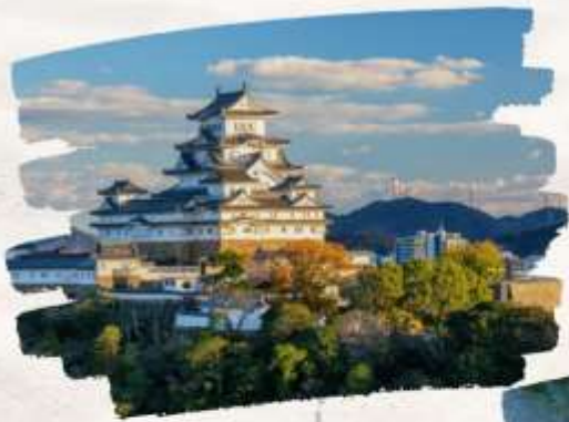
ปราสาทฮิเมจิ